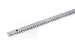
Model 4 kaynaklı bağlantı parçaları ile galvanize kremayer 30x12 (4 m'lik paket)