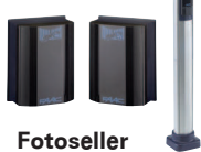
Fotoseller ve Kolonlar sayfa 163