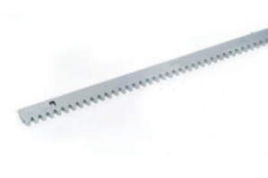
Model 4 kaynaklı bağlantı parçaları ile galvanize kremayer 30x8 (4 m'lik paket)