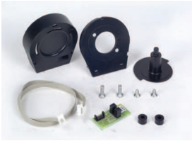
740 D için kodlayıcı (*)