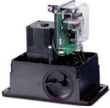
Dahili kontrol paneli 740 D Teknik özellikler sayfa 144