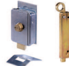
Çeşitli aksesuarlar sayfa 168