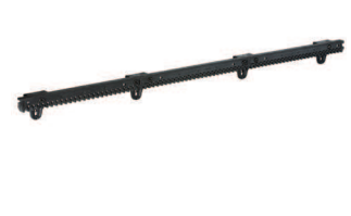
Çelikle güçlendirilmiş 30x20 kremayer ve gerekli sabitleme aksesuarları (4m'lik paket) maks. kapı ağırlığı 400 kg